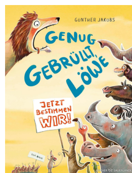
Günther Jakobs: Genug gebrüllt, Löwe - jetzt bestimmen wir. Fischer Verlag