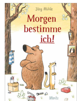
Jörg Mühle: Morgen bestimme ich! Moritz Verlag